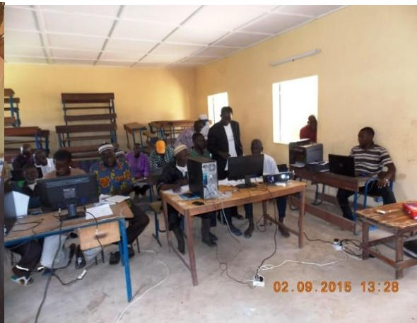
Alimentation énergie solaire